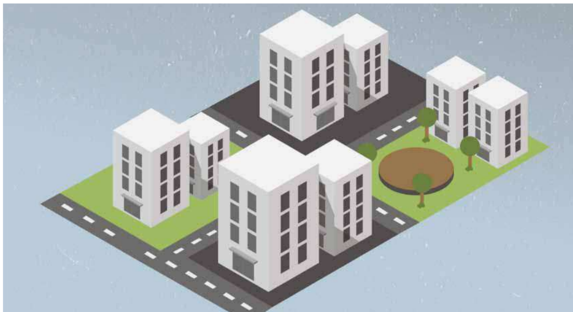
Иллюстрация Ольги Дмитриевой

Группа компаний «В72» приступила к строительству квартала «Чемпионский» в районе ДОКа. В будущем