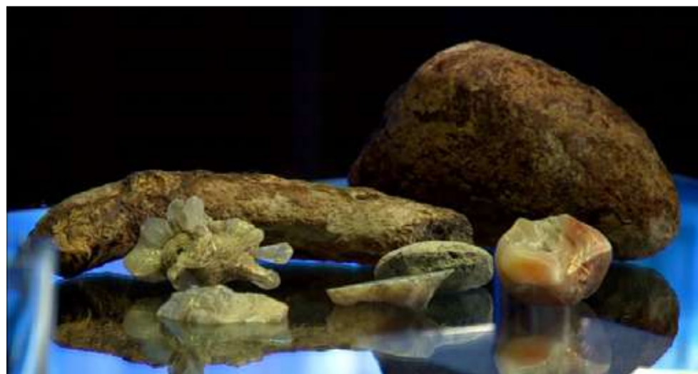
Находки из экспедиции

– Вот эти две самых больших находки – родственники. Мы привезли их с Кыштырлинского карьера, это недалеко от поселка Винзили. Там добывают глину для строительных целей. Пока есть две версии, что это такое, и одна смешнее другой. Это однозначно окаменевшая органика.